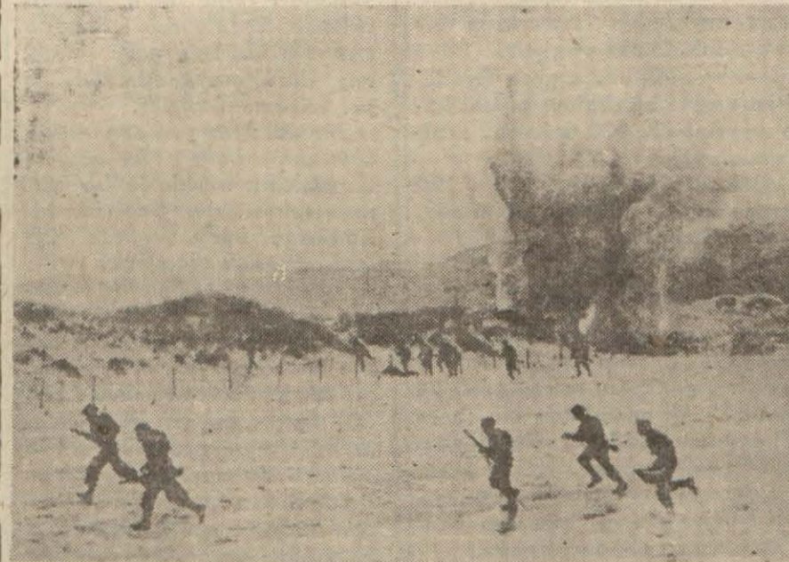
Topçu ateşi altında bir sahile çıkarılan Amerikan askerleri çarpışırken

Cezair açıklarında büyük bir deniz muharebesi oluyor